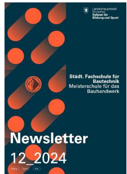
2024 – 20xx