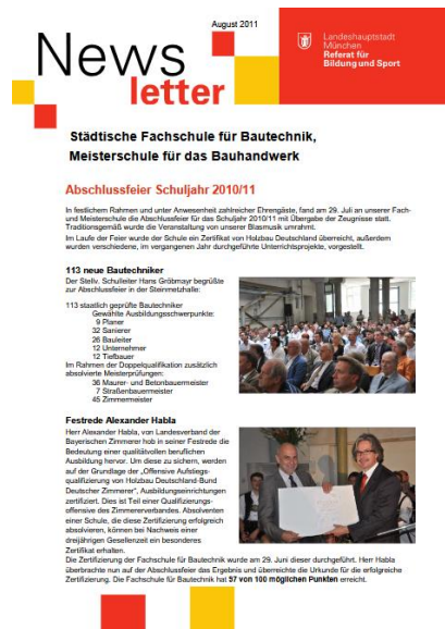
2011 – 2024