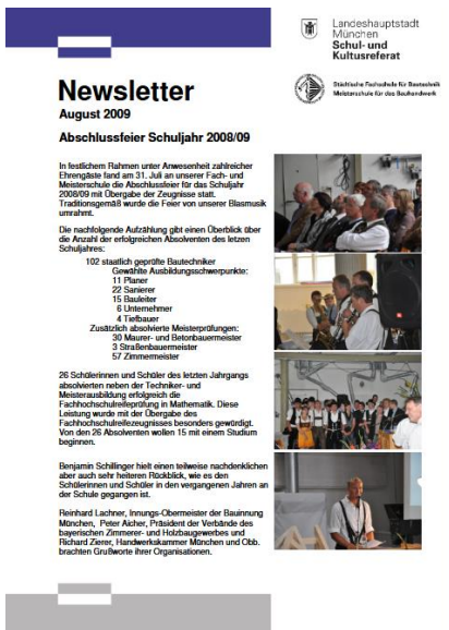
2007 – 2011

Tatsächlich bekommen Sie heute zum ersten Mal seit 13 (!) Jahren einen Newsletter in neuem Outfit! Die Landeshauptstadt München kleidet uns digital neu ein und wir bedienen uns aus dem neuen Baukasten/Styleguide. Insgesamt ist es die dritte Layoutänderung seit unseren digitalen Anfängen 2007 und wir freuen uns, nach langer rot-gelber Zeit neue Farben, Designs, KeyVisuals, etc. auszuprobieren. Und Sie, liebe Leserinnen und Leser, dürfen sich weiterhin vorwiegend auf die Texte und Bilder konzentrieren!