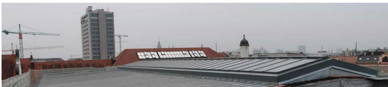
Bild vom neuen Dach des Gebäudeteils E (mehr davon auf der Homepage )