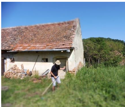
Freilegen des Areals mit Sense

Abends kamen die „Neuen“ zum ersten Mal in den Genuss des herrlichen Essens, das man sein Leben lang nicht mehr vergessen wird! Für die Lehrer jedoch mit einem Wermutstropfen, denn vor 2 Monaten ist Amalia, Küchenchefin und „General“ seit 2010, plötzlich und unerwartet mit 74 Jahren verstorben. Wenigstens hat Milli mit Alina und auch mit Unterstützung durch viele andere die Küche übernommen, um uns maximal glücklich zu machen!