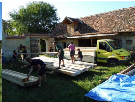
Abladen der Holzlieferung