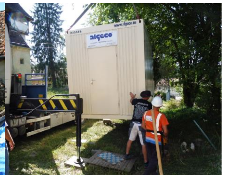
Einheben des Containers