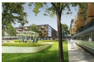
Pflegewohnhaus Baumgarten Wien