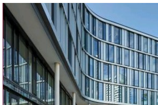
Bürogebäude Arabeska München